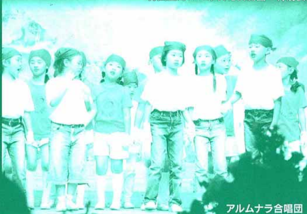
アルムナラ合唱団